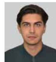
デニス ドロシェンコ Denys DOROSHENKO 復興局長 Head of the Department for Restoration and Development 復興庁 The State Agency for Restoration and Development of Infrastructure of Ukraine (Agency for Restoration)