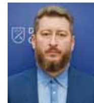
ヴォロディミル ミツレール Volodymyr MILLER 副市長 兼 経済・財務・予算部長 Deputy Mayor on Executive Issues Director of the Department of Economics, Finance and City Budget ドニプロ市 Dnipro City Council